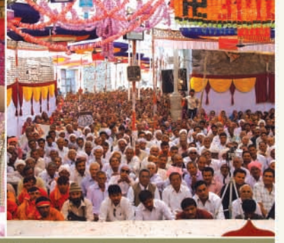
માંડવધાર(ગઢડા)ને આંગણે યોજાયેલ નૂતન શ્રી સ્વામિનારાયણ મંદિરનો ભવ્ય 'મૂર્તિ પ્રતિષ્ઠા મહોત્સવ' (તા.૧૩-૩-૨૦૦૯)