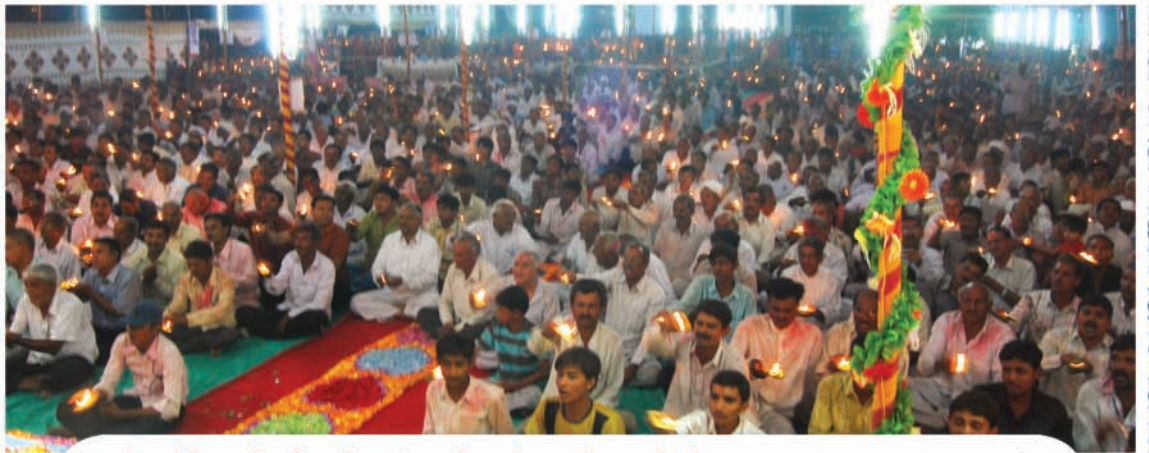
અનેક શહેરો, નગરો અને ગામોગામથી જન્મોત્સવનો લાભ લેવા પધારેલ વિશાળ ભક્ત સમુદાય દ્વારા સમૂહ આરતી.