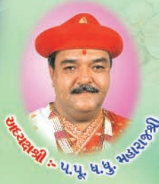
उपध्यक्षश्री :- प.पू. ध.पु. महाराजश्री

विपाध्यक्ष : प.पू. १०८ श्री दावलु महाराज श्री गुणेंद्रप्रसादलु महाराजश्री - वडताल