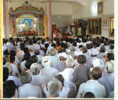
વેળાવદરને આંગણે યોજાયેલ નૂતન શ્રી સ્વામિનારાયણ મંદિરનો ભવ્ય 'મૂર્તિ પ્રતિષ્ઠા મહોત્સવ' (તા.૧૩-૩-૨૦૦૯)