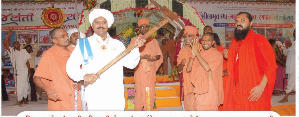
કાઠિયાવાડ પ્રદેશમાં પધારી કાઠિયાવાડી પોશાકમાં અધર્મને નાશ કરવા હળને ઉપાડતા પ.પૂ. લાલજી મહારાજશ્રી.